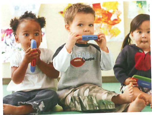
Durch Musik erleben