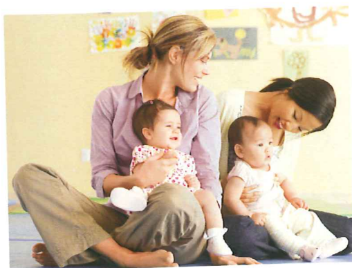
Nähe und Gemeinschaft