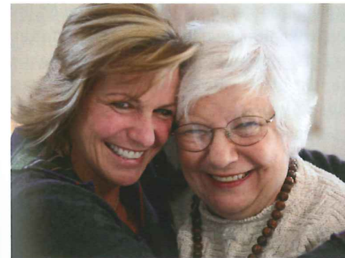
Vertrauen erzeugt Geborgenheit