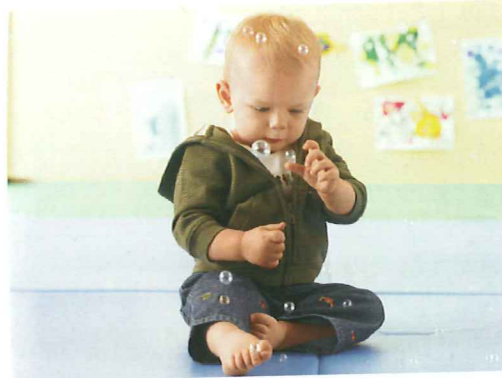
Beobachten und begreifen