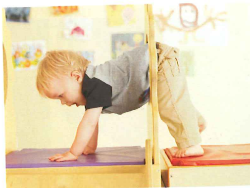
Bewegung und Gleichgewicht