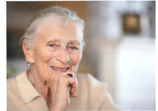
Wertschätzung ist Glück