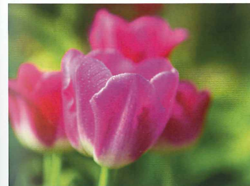
Schönheit fördert Lebensfreude